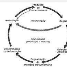
Ciclo da Informação

47. Analise a proposta de Ciclo da Informação de V. Dodelei (2014) e, em seguida, o levantamento dos recursos de algumas das redes sociais.